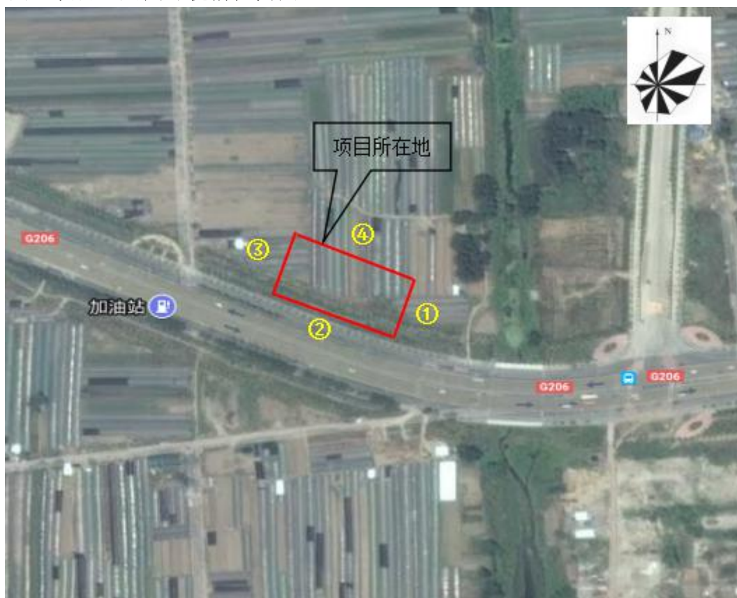
图 1 项目周围环境情况简图