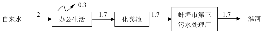
图 3 项目水平衡图 单位：m 3 /d

由上表可以看出，本项外排废水主要污染物排放满足蚌埠市第三污水处理厂接管标准，经蚌埠市第三处理厂处理达标后，最终汇入淮河，对淮河水质影响较小。