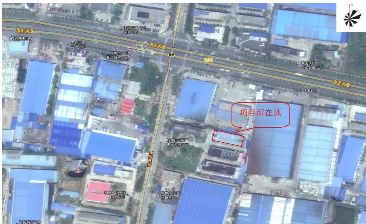
图 1 项目四周情况简图